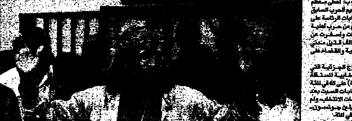
عقب فوز تابلور في انتخابات الرئاسة

عقب 3 سنوات على اقامة جنوب أفريقيا الجديدة نظام مانديلا لم ينجح في القضاء على ظاهرة الانقسام العنصري